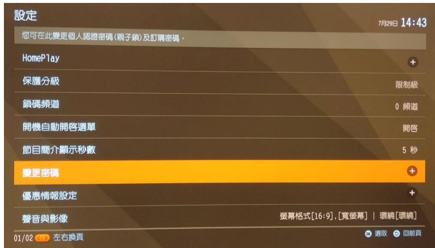
圖4：設定個人認證密碼

在頻道頁面，按下遙控器的 選單 鍵開啟選單，選擇「設定 > 變更密碼 > 個人認證密碼」，按下 OK 鍵後即會跳出變更密碼視窗，輸入舊密碼、新密碼並選擇「確認」後，即可完成設定（如圖4、圖5）。