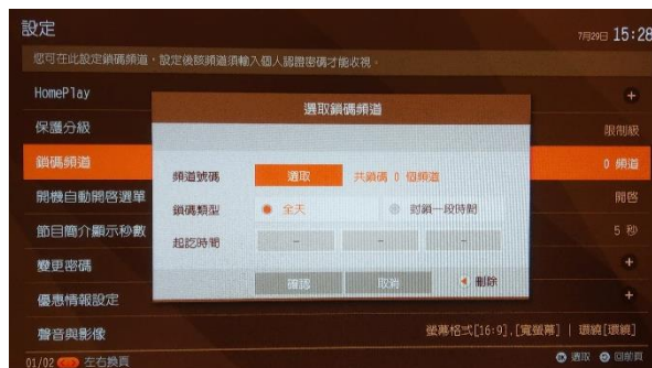
圖7：鎖碼頻道設定頁面