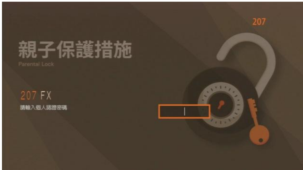
圖1：頻道鎖定後畫面

使用親子鎖(保護分級)的功能，經鎖定後的節目或頻道，收視前需輸入個人認證密碼，即親子保護鎖（如圖1），輸入四碼認證碼之後（預設為0000），按 OK 鍵即可收視；按 i 介紹鍵可開啟/關閉認證碼輸入框，按下選台鍵可切換至其他頻道。