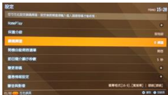
圖 1 設定鎖碼頻道

移動指標至左邊的所有頻道列表，即可按下 OK 鍵將欲加入的頻道丟到右邊成為鎖碼頻道，若您需要選擇的頻道排序較後面，您可直接輸入頻道號碼，如「25」，此時指標會直接移至「25」，按下 OK 鍵後即可新增；反之，移動指標至右邊的鎖碼頻道列表，按下 OK 鍵就能將欲刪除的頻道直接刪除（如圖 3）。按下「確認」後即會儲存設定。選擇完欲鎖碼頻道後，可選擇鎖碼時段（全天、封鎖一段時間），完成後按下「確認」以儲存設定。