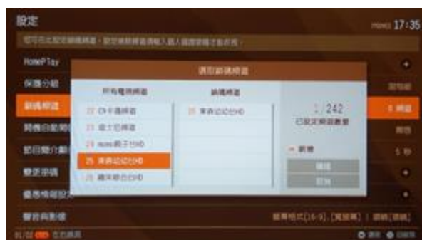
圖 3 頻道列表