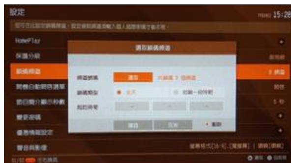
圖 2 鎖碼頻道設定頁面