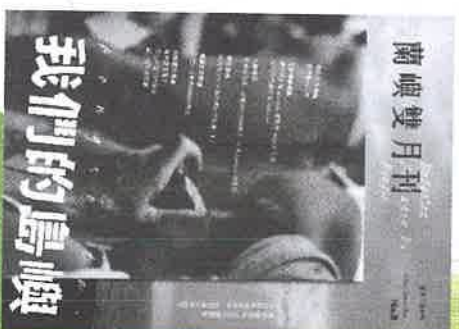
第八期： 我們的島嶼