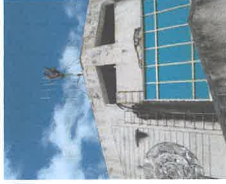
維修保養天線、鐵塔