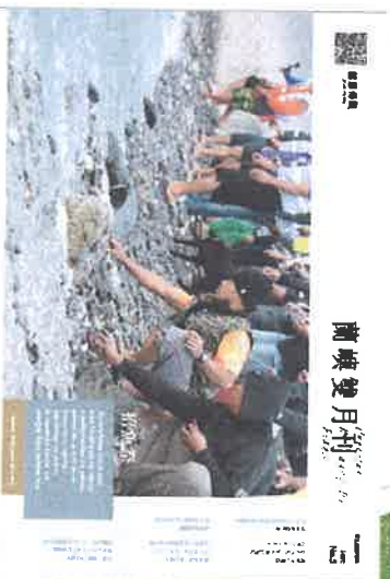
第五期： 部落裡的招魚祭