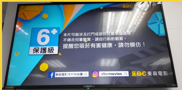
分級標誌及加註警示訊息

《電視節目分級處理辦法》規定以兒童為主要收視對象之頻道或節目所播送之廣告內容、時間限制應符合「普」級或「護」級，並依敏感性情節加註警示訊息、依分級標識或時段提供節目親子鎖。