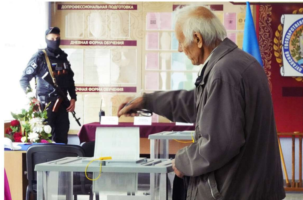
俄羅斯武裝軍人監視佔領區民眾投票。