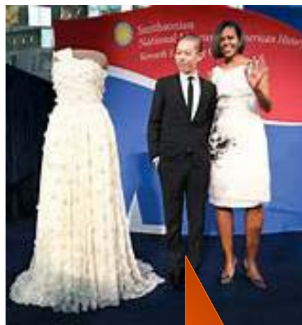
國際知名設計師吳季剛